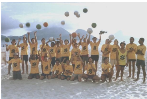
Patrocínio do Banco do Brasil, SUPER-RJ