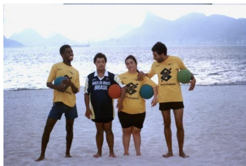
Participação de 20 alunos da APAE